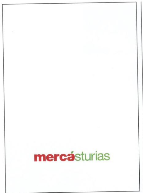
medidas: 210 x 297 mm (A4). moc